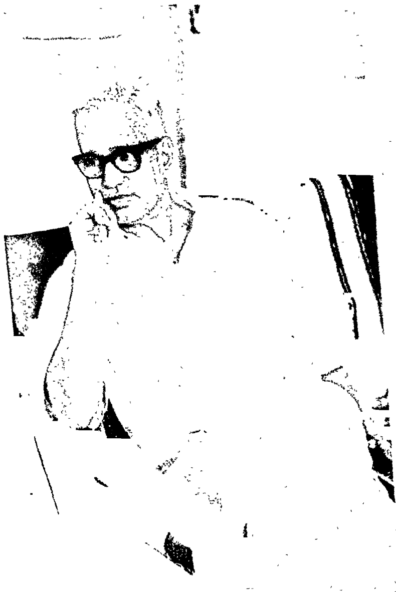
महाकवि जी, शंकर कुरुप